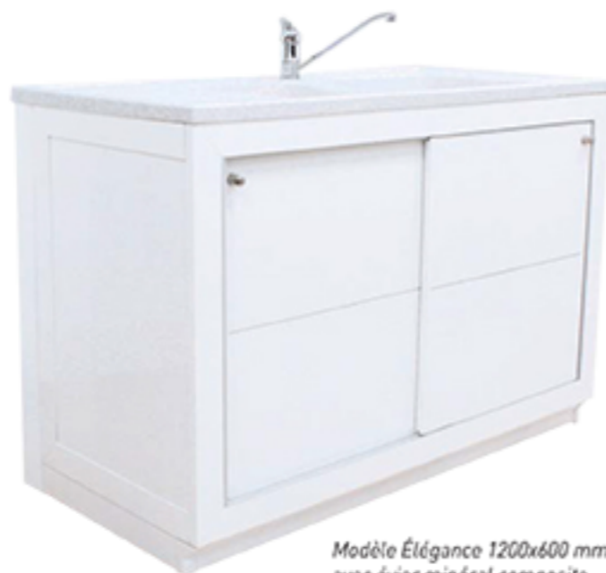
Modèle Élégance 1200x600 mm avec évier minéral composite

L'entretien est facilité par un plancher amovible pour permettre le nettoyage au sol. Le meuble ne nécessite rien d'autre qu'un nettoyage de surface.