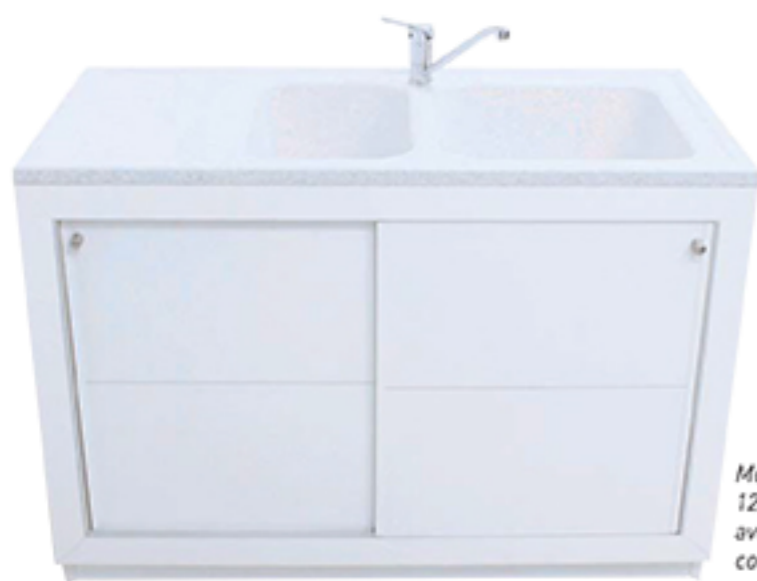
Modèle Élégance, 1200x600 mm avec évier minéral composite